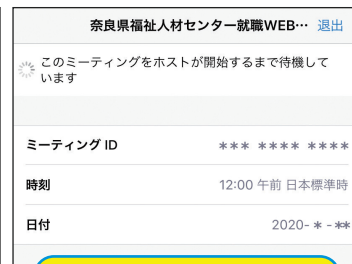
スマートフォン画面

事前確認方法について詳しくは、ステップ2のメールでご案内するマニュアルをご参照ください。